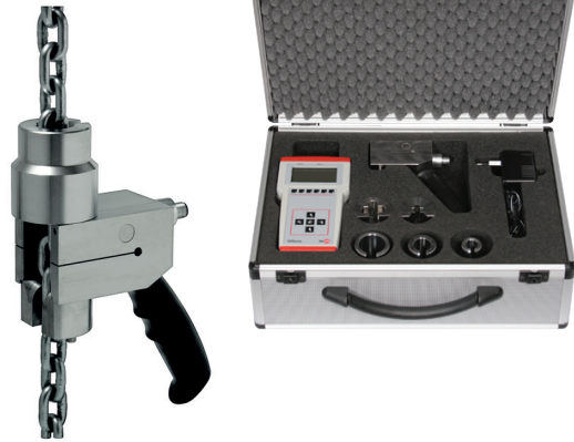
Комплект тестового оборудования для цепных подъемников, модель FRKPS

Преобразователь силы работает как тензодатчик балочного типа и поэтому на него не влияют паразитные силы и крутящие моменты. Выходной сигнал передается по кабелю к переносному индикатору. Для испытаний цепных подъемников любого типа в указанном диапазоне нагрузок требуется два цепных переходника и три центрирующие втулки.